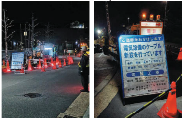
工事現場の案内看板

本工事は主に夜間に実施され、最終的な完了まで約10年を要する長期的な改修工事です。