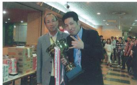
団体戦優勝 ブルミッシュAチーム