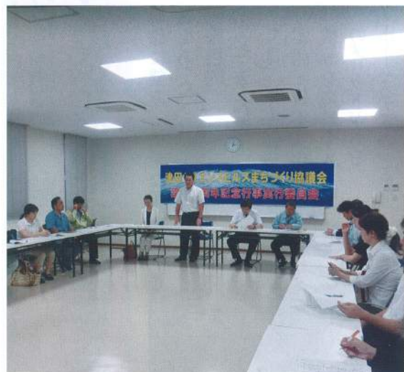
8月29日第1回実行委員会を開催 (北大阪高等職業技術専門学校会議室)

発行所 津田サイエンスヒルズ まちづくり協議会 〒573-0128 枚方市津田山手2-1-1 吉泉産業(株)内 TEL (072)858-5901 FAX (072)858-5904 (題字:墨アーティスト 樋笠 幸三書)